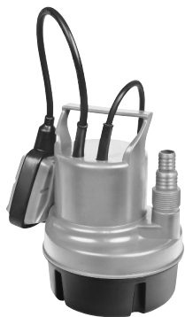
Serie AL 7993 X 410