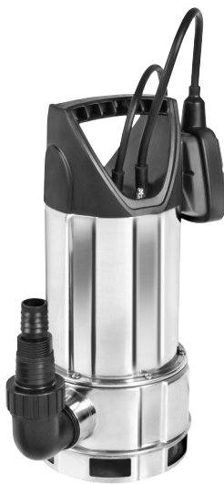
Serie AS 7993 X 415