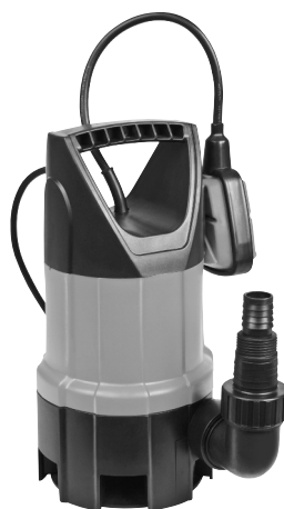
Serie AS 7993 X 412