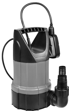
Serie AL 7993 X 411