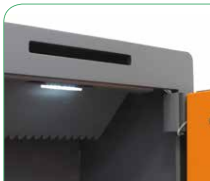
Rampa "antipesca" que evita que se extraiga el contenido desde el exterior.