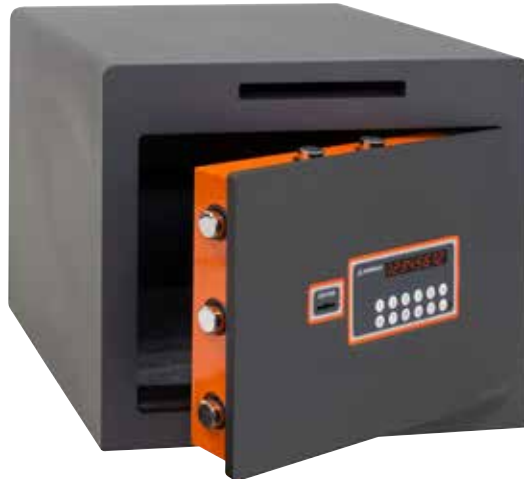
PLUS C CON RANURA Ref. 180050-SL

! Al tratarse de una CERRADURA CERTIFICADA , el duplicado de llaves solo puede realizarlo un Servicio de Asistencia Técnica autorizado por Arregui, siendo necesario acreditar la propiedad de la caja fuerte y presentar una llave original.