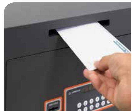
Ranura de 162x15 mm para introducir documentos o billetes sin necesidad de abrir la caja.