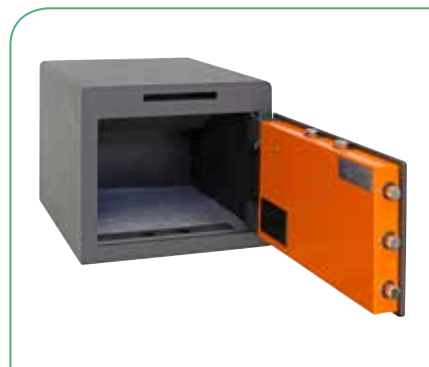
Bulones giratorios y guiados que impiden su corte desde el exterior. Alojamiento interno para bulones.

! Al tratarse de una CERRADURA CERTIFICADA , el duplicado de llaves solo puede realizarlo un Servicio de Asistencia Técnica autorizado por Arregui, siendo necesario acreditar la propiedad de la caja fuerte y presentar una llave original.