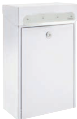
BLANCO EP1001 EAN-8425181738375