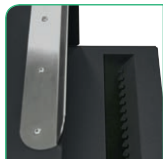
Rampa antipesca que impide extraer los paquetes