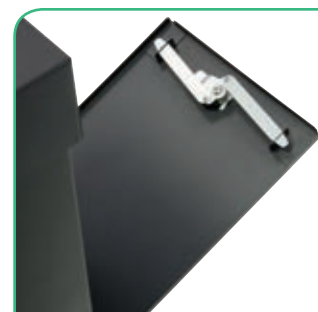
Seguro y robusto, con 3 puntos de cierre.