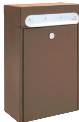
ÓXIDO EP1008 EAN-8425181738399