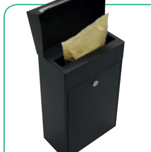
Ideal para entregas en sobres grandes y paquetes flexibles