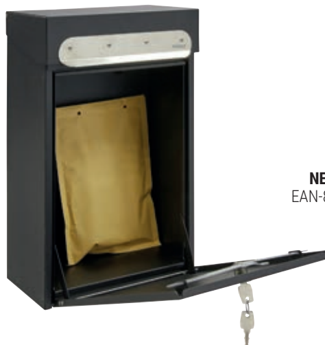
NEGRO EP1004 EAN-8425181738382