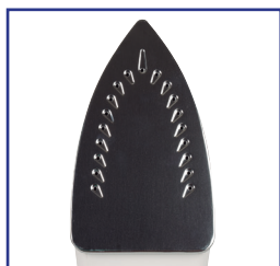
Suela acero inox