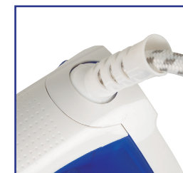
Cable giratorio 360°