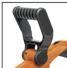
EMPUÑADURA AUXILIAR AJUSTABLE