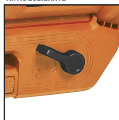
PALANCA PARA CAMBIO ASPIRADO/SOPLADO