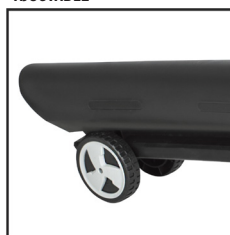
RUEDAS PARA FACILITAR LA CONDUCCIÓN