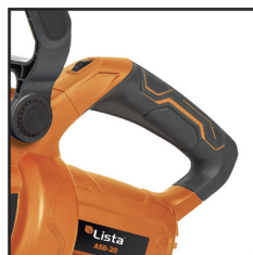
EMPUÑADURA ERGONÓMICA ANTIDESLIZANTE