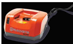
CARGADOR BATERÍA QC330 970 52 22-01