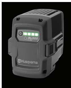
HUSQVARNA BATERÍA BLI300 967 07 19-01