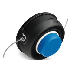
TRIMMY T35X 578 44 65-01