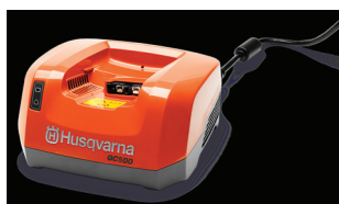
CARGADOR QC500 970 44 95-01