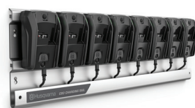
RAÍL DE CARGA CON CARGADORES 40-C80 970 62 19-01