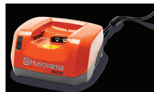
CARGADOR DE BATERÍA HUSQVARNA QC330 966 73 06-01