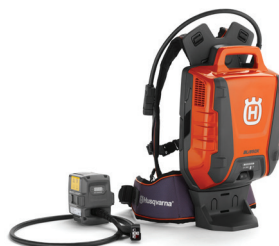
BATERÍA BLI950X 967 09 32-01