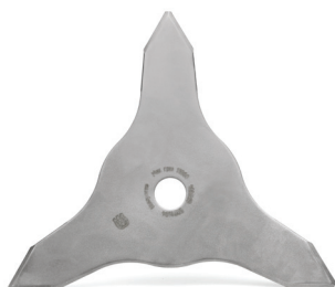
HOJA HIERBA 3-DIENTES 578 44 49-01