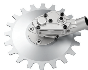
CABEZAL RECIPROCATOR RA-V 967 90 86-01