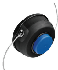
TRIMMY T25 578 44 61-01