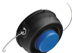
TRIMMY T35 578 44 63-01