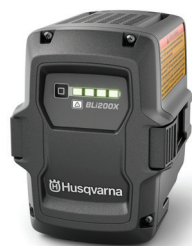
HUSQVARNA BATERÍA BLI200X 970 44 89-01