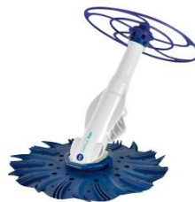
Limpiafondos automático Automatic cleaner 90397