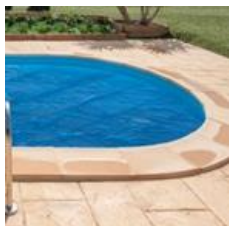
Cubierta isotérmica Isothermic cover CVPE420