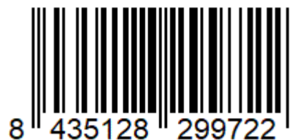
Foto del producto